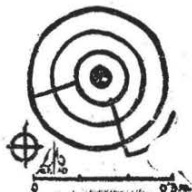
Petroglifo 2.— Grabado en roca del "grupo gallego". En mina La Rosa, Arteixo.

Desde la cumbre del monte dos Allos, a unos doscientos metros de altitud se divisa un extensísimo y paradisíaco panorama; al N. la amplia y azul redondez del mar Cantabricum de griegos y romanos, que mira a la Armórica (Bretaña), Albión o Britania e Hibernia (Irlanda); al E., S. y W. se dibujan muchos montes y unas cincuenta parroquias y lugares y de E. a W. los siguientes sitios de interés arqueológico, que muestran la gran importancia que tiene esta comarca, transición entre las Mariñas dos Frelres y Bergantiños: Castro de Muros (SW. Insua de Suevos), Suevos, Castro de Pastoriza, Oseiro con iglesia románica de la segunda mitad del siglo XII, amilladoiro de A Furoca, dos amilladoiros de O Moucho (Oseiro), Castro de Figueroa, Castro de Arteixo, dos mámoas en el monte mismo dos Allos, Castro de Peán, mámoa de Monte de Areas, dos mámoas encima de Orro, iglesia de Loureda con retablo de Ferreiro (siglo XVIII), tres casas rectangulares medievales (?) del monte das Insuas (SW. de Erbedins, Loureda), castro de Santa Leocadia, Marco d'Anta (menhir?; 500 metros SW. de Santa Leocadia), castro de Pereira (Erboedo, Gerceda), castro de Larín (Arteixo); iglesia románica de Lañas, castro de Lañas, con escorias de fundición de estaño, Roris (donde apareció un escondrijo de diez hachas de bronce de talón con dos asas de tipo nervado y pidiagonal, una de las cuales con mazara de fundición, lo que pre-