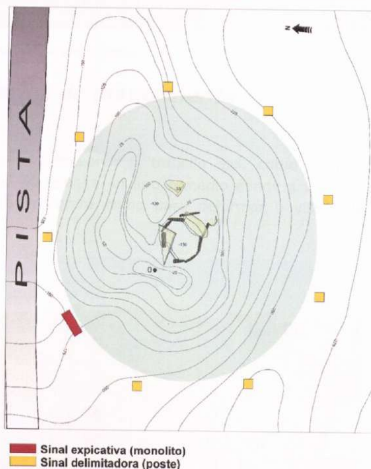
Figura 1. Plano do xacemento con indicación da ubicación das sinais

Con anterioridade a esta acción executouse a roza da vexetación existente nun xacemento nun diámetro de 5 metros ó redor do mesmo.