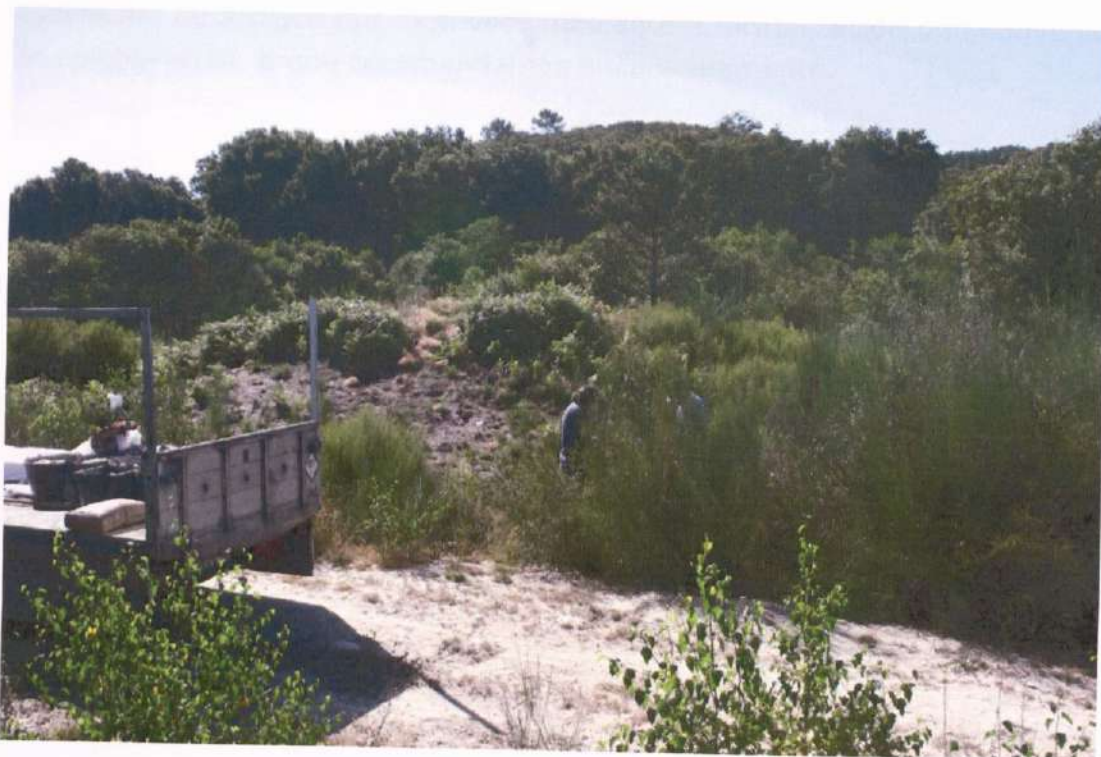
Foto 4. Aspecto xeral do xacemento o comezaren vos traballos de sinalización.

O aspecto do xacemento ó empezaren o traballo era, como podíase esperar, de total abandono. Xa pasara un ano e medio dende a primeira intervención e a vexetación medrara como para deformar a visión do túmulo (foto 4).