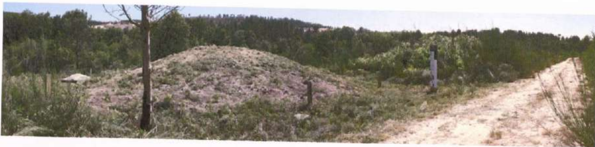
FOTO 3. Aspecto do xacemento ó finalizar vos traballos.