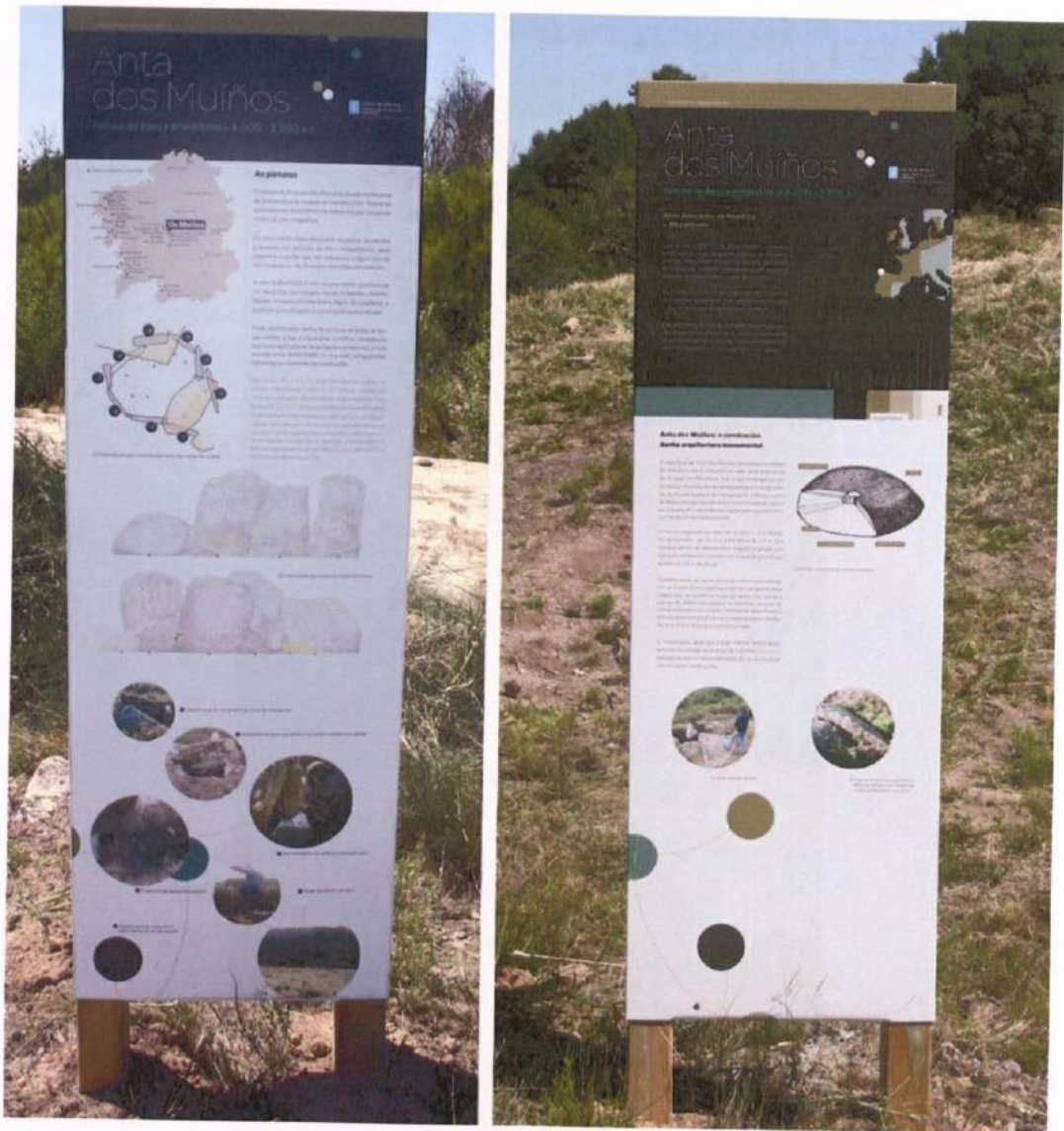
FOTO 1. O monolito unha vez instalado